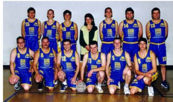
1999: Turnverein im neuen Dress

Die gesamte Mehrzweckhalle wird renoviert.