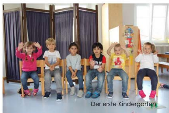
Der erste Kindergarten