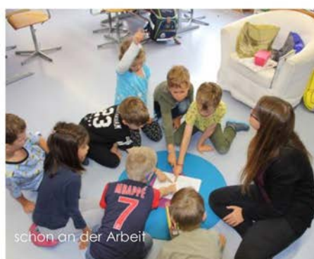
schon an der Arbeit