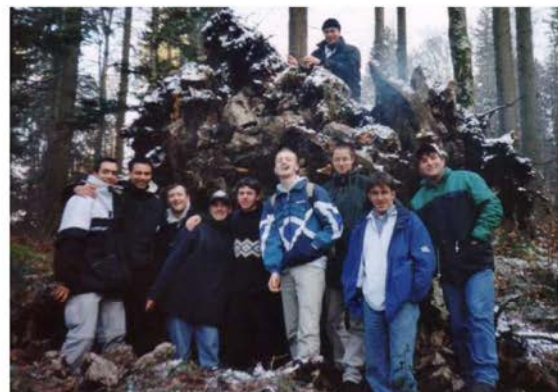
2000: Ausmarsch rund um die Wasserfallen