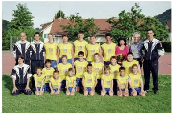
2002: Jugendriege im neuen Dress