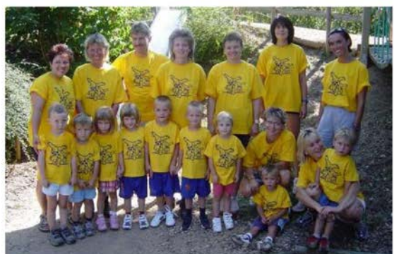
2003: MUKI-Turnen an der Bezirks-Olympiade in Diegten