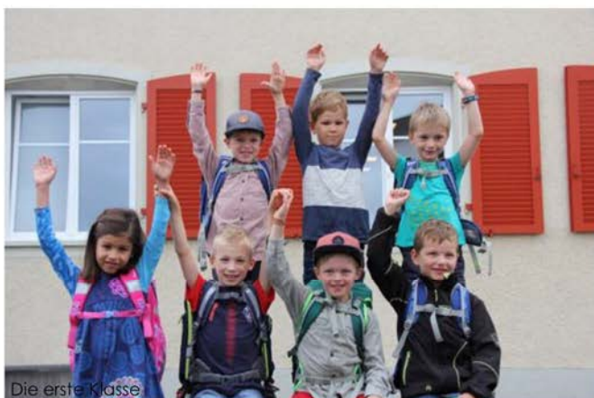
Die erste Klasse