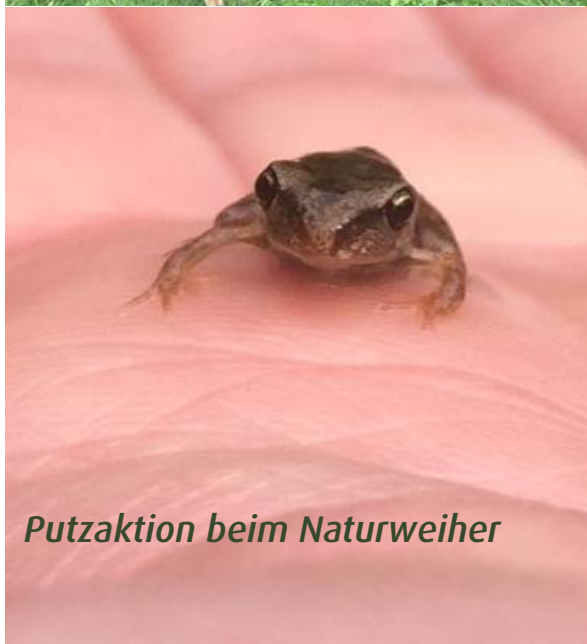
Putzaktion beim Naturweiher